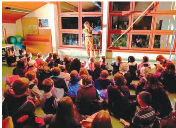
... même pas peur...

Est-ce dû au dérèglement climatique ou à un été indien bien plus long et chaud que d'habitude, au retour de l'humidité et de la fraîcheur, toujours est-il que c'est avec un peu d'avance qu'on a pu, vendredi dernier, à la tombée de la nuit, apercevoir dans les rues de Wavre des escouades de zombies, loups-garous, sorcières et autres monstres. Tous avaient, pour accéder à leurs nourritures préférées que sont les friandises en tout genre, revêtus des déguisements plus fous et effrayants les uns que les autres. Les citoyens de Wavre n'ont pas eu d'autre choix que d'accéder à leur demande.