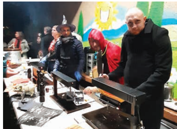
Des zombies qui savent râcler

Aux dernières nouvelles, repus et satisfaits les monstres ont regagné leurs tanières et autres grottes pour se rendormir pour une année entière. DJ