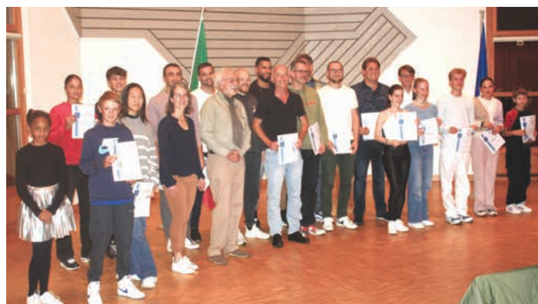
Les mérites laténiens 2023