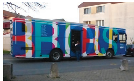
Des livres à consommer sans modération