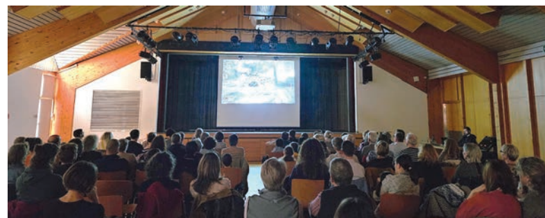
Une salle comble, un public captivé