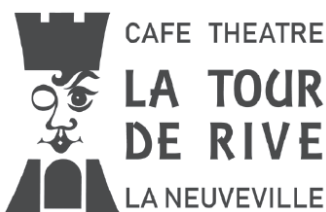
Illustration: Anouche DEMARTIN

Café-Théâtre de la Tour de Rive Lees Floyd & Big easy Gators Vendredi 18 octobre 2024 à 20h30